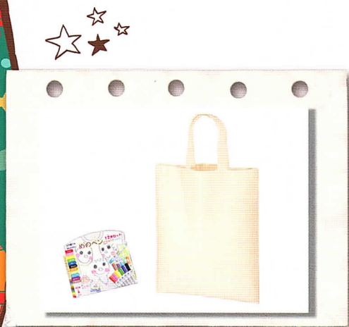
提供されるコットンバッグとペン

「おもちゃ図書館で楽しい創作活動を!」と、(株)make様より5回目となります 「マイバッグづくり」の資材提供のお申し出をいただきました。応募された おもちゃ図書館には、コットンバッグと布用のペンが送付されます。それを 使って、自由に素敵なマイバッグを作りましょう。