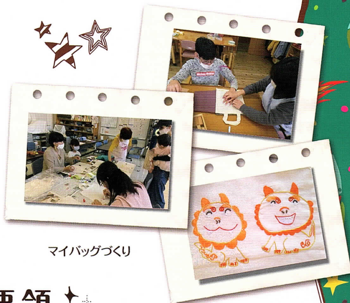
マイバッグづくり