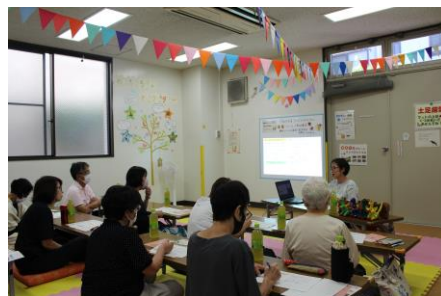
すみだおもちゃサロンにて