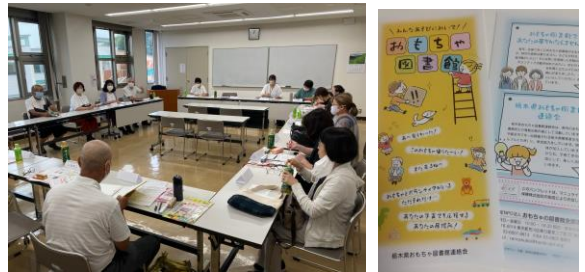
パンフレットはマニュアルライフ生命様からの助成で作成しました