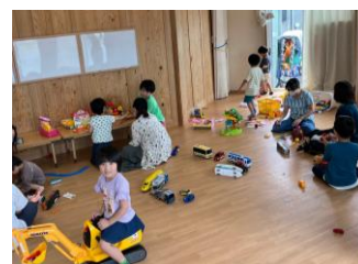
(右) 現在の開館日の様子