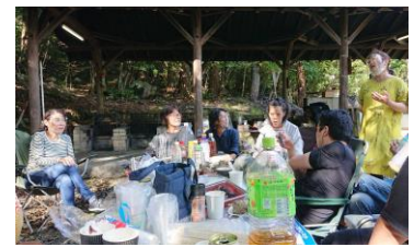
(右) げんき村バーベキュー