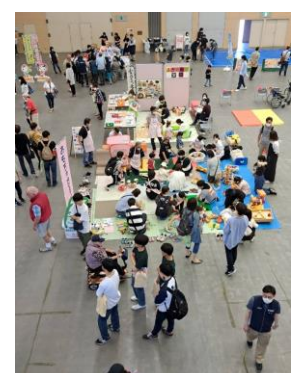
(右) 釧路市ふれあい広場