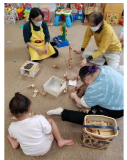
（左）開設当初新聞の取材を受けました（右）現在の開館日