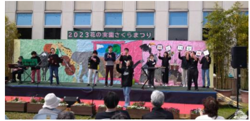
花の実園 さくらまつりでの音楽発表