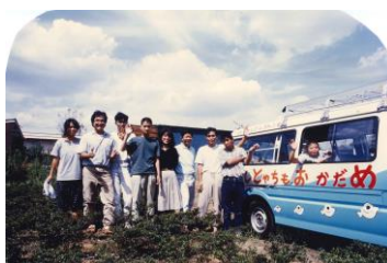
(左) 1990年頃 ボランティアさんと 寄贈されためだか号と一緒に