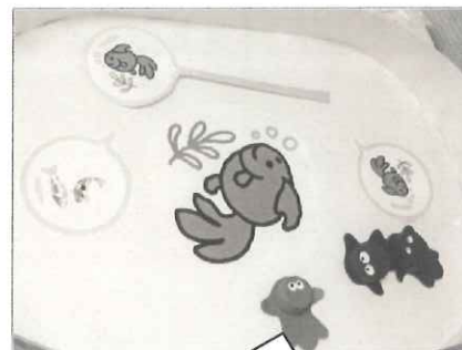
分科会②金魚すくい ペットボトルのふたを使用