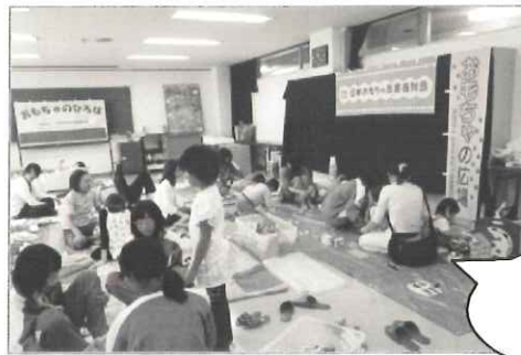
賑やかでした！ おもちゃ広場